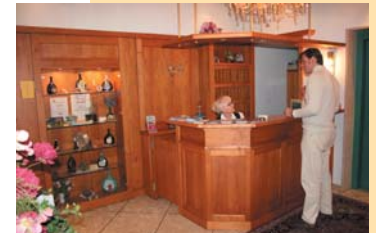
Einen angenehmen Aufenthalt ermöglicht Ihnen unser kompetent geschultes Personal