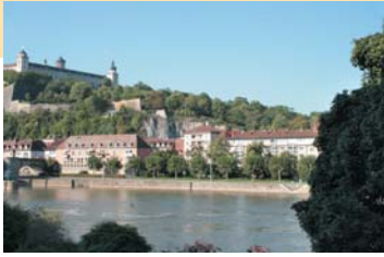
Der Blick aus dem Hotel auf die Festung ist immer ein Genuss.