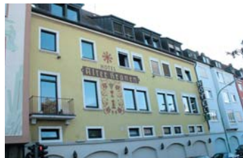
Blick auf die Hotelfront, direkt vom Mainufer.