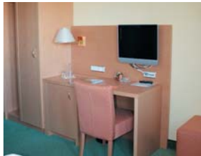
Alle Zimmer sind modern und komfortabel eingerichtet.