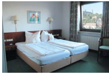
Sie schlafen trotz Lage im Zentrum sehr ruhig - wenn Sie nicht das Würzburger Nachtleben genießen